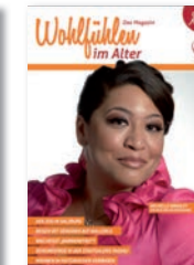
Wohlfühlen im Alter Magazin Chefredaktion