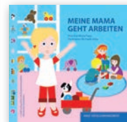
Meine Mama / Mein Papa geht arbeiten