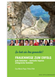
Frauenwege zum Erfolg