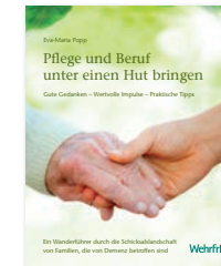
Pflege und Beruf unter einen Hut bringen