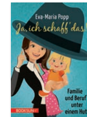
Ja ich schaff' das